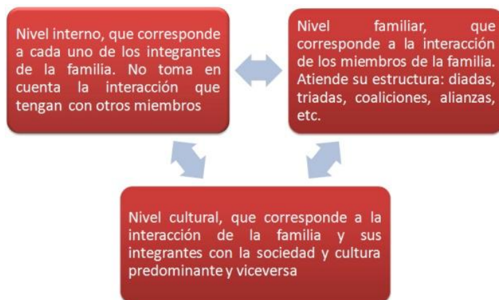
Figura 1: Niveles de intervención del modelo ecosistémico

Tal como se esquematiza en la figura 1, cada nivel funciona como un holón que (aun cuando puede ser estudiado individualmente de manera exitosa y ofrece un panorama más enriquecedor al atenderlo como un sistema, que presenta organización, jerarquía y relaciones activas con el medio, lo cual remite a la idea de L. von Bertalanffy: el todo es más que la suma de sus partes (Bertalanffy, 1984)). Este modelo reconoce la existencia de tres estructuras relacionadas con el abuso sexual, que interactúan al interior del sistema familiar: el nivel interno, el familiar y el cultural o social.